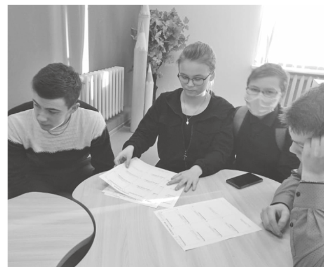
Команда нижеиленских школьников – победители игры «ПолитикУМ».