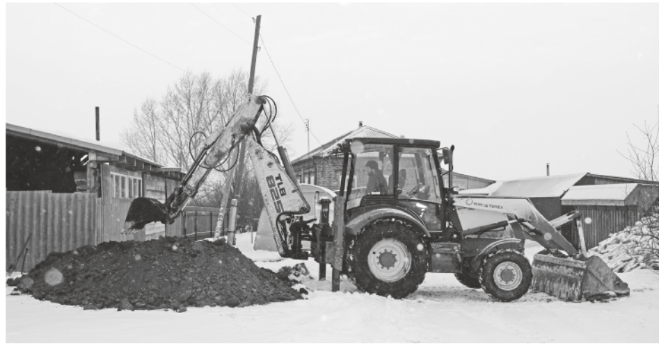
Газопровод будет подведён к каждому дому.