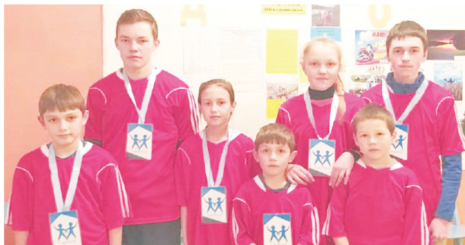
В номинации «Мы социальный отряд» победил подростковый клуб «Детство».

В номинации «Мы социальный отряд» заслуженно победил п/к «Детство». Ребята организуют и проводят акции, спортивные-оздоровительные мероприятия, субботники, поддерживают чистоту в родной деревне, на роднике. Собирают информацию о истории